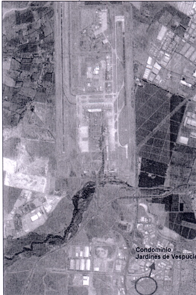
Ilustración 1 Ubicación Aeropuerto y Condominio Jardines de Vespucio

( http://www.dgac.gob.cl/portalweb/dgac/aeropuertos/monitoreoRuidoAeropuertoAMB )