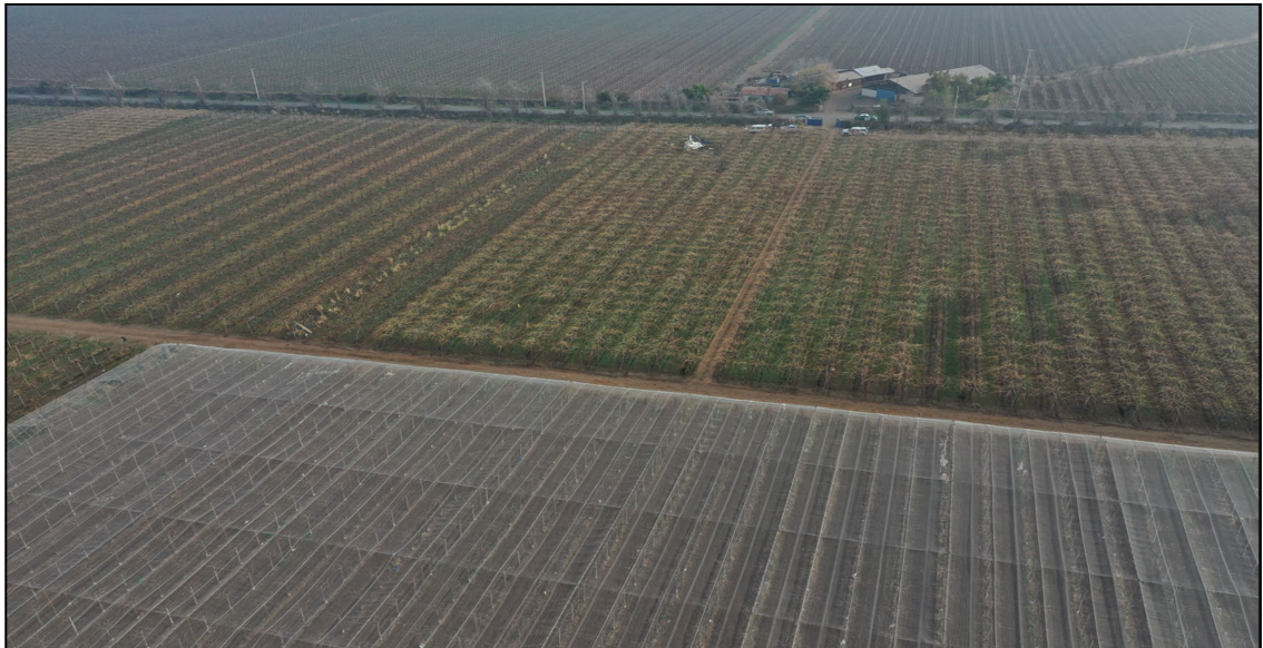
Fotografía N°1: Lugar del Sitio del suceso.