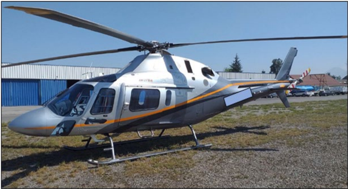
Fotografía N°2: Imagen de la aeronave antes del accidente.