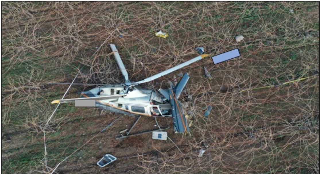
Fotografía N°3: Posición final de la aeronave después del accidente.

Los daños encontrados en la aeronave fueron causados por el impacto de la aeronave sobre un terreno agrícola (viñedos) de consistencia dura.