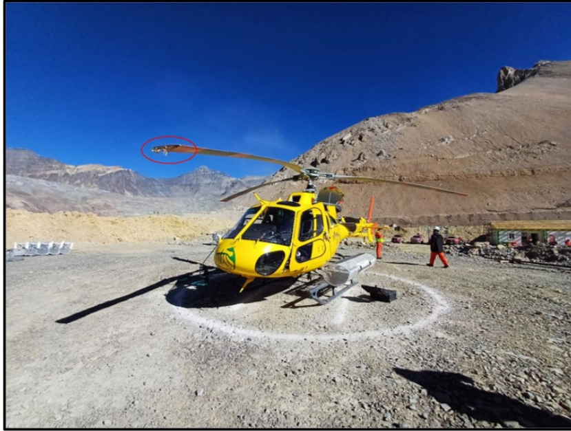
Imagen N°3: Aeronave posada en el lugar de aterrizaje.