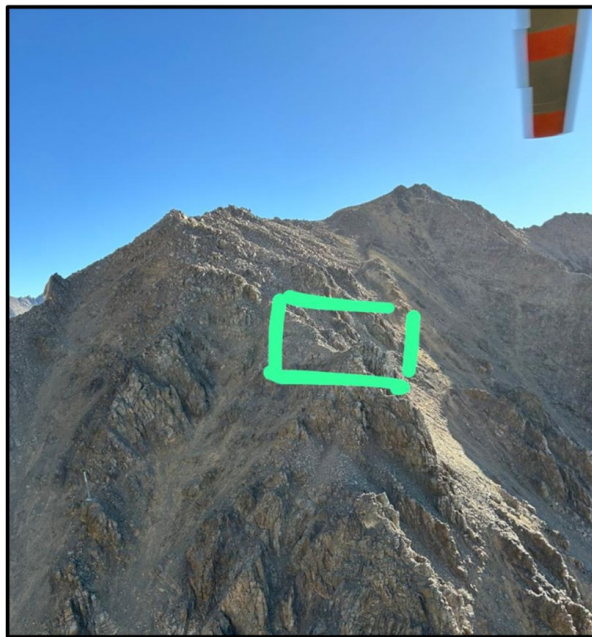
Imagen N°2: Sitio del suceso.

Las características del sitio del suceso eran una ladera de un sector montañoso con una pronunciada pendiente, el terreno tenía una consistencia dura de tierra y rocas, sin vegetación, con una elevación de 11.800 pies (3.600 metros) aproximadamente.