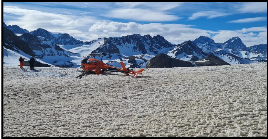
Fotografía N° 1: Vista de la aeronave, en el terreno.