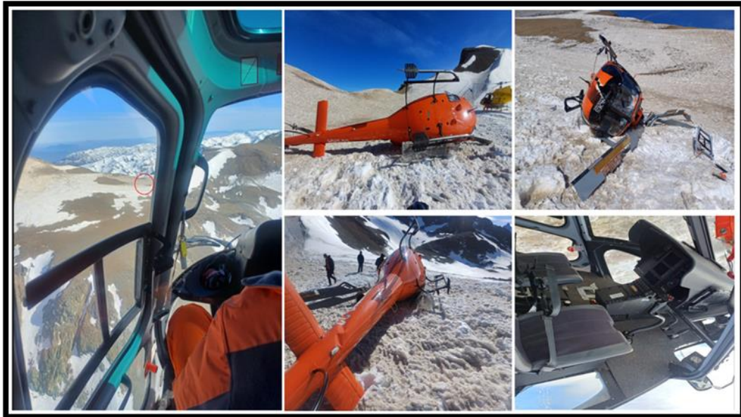
Fotografía N° 2: Vista de la aeronave.

La aeronave se encontró con daños y apoyada contra un terreno nevado, con su nariz orientada con rumbo Norte, conforme a la fotografía N°2.