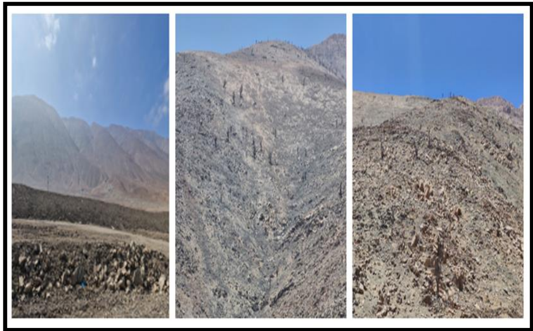
Imagen N° 3: Lugar del suceso.