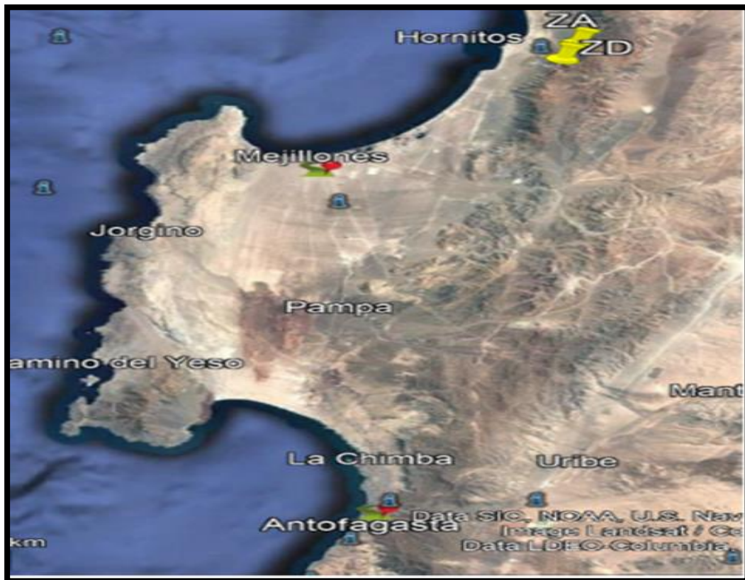
Imagen N° 1: Zona del suceso.

El sitio del suceso corresponde a un sector ubicado a 5 kilómetros al Este del Balneario “Hornitos”, comuna de Mejillones, Región de Antofagasta, en las coordenadas: 22° 55' 42,45" S / 70° 15' 03,51" W, con una elevación de 1000 metros AGL, conforme a la imagen N°1, N°2 y N°3.