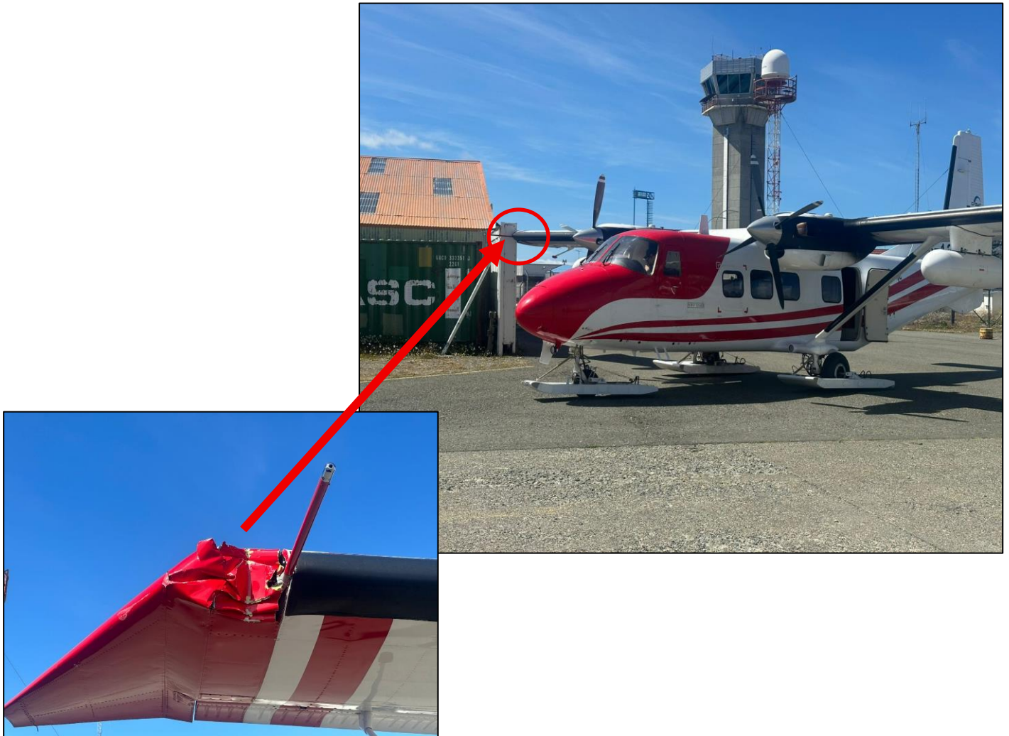
Fotografías 1 y 2: Aeronave del suceso e impacto del ala derecha