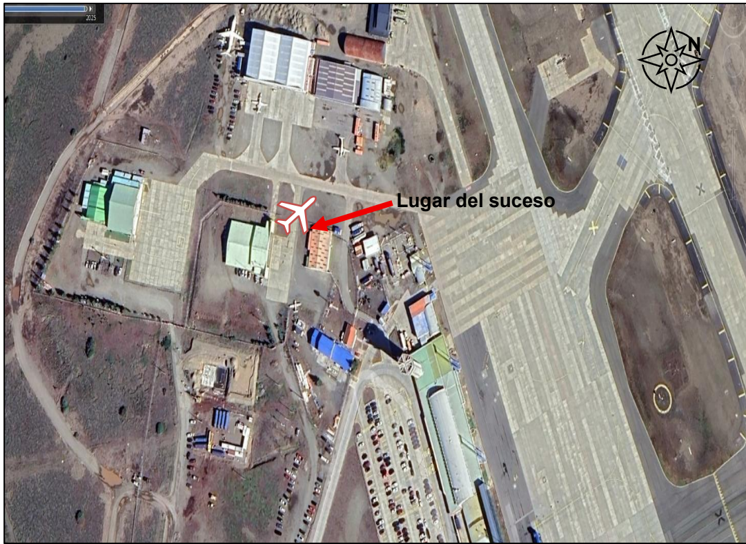
Imagen 1: Aeropuerto Pde. Carlos Ibañez del Campo, hangar club aéreo.