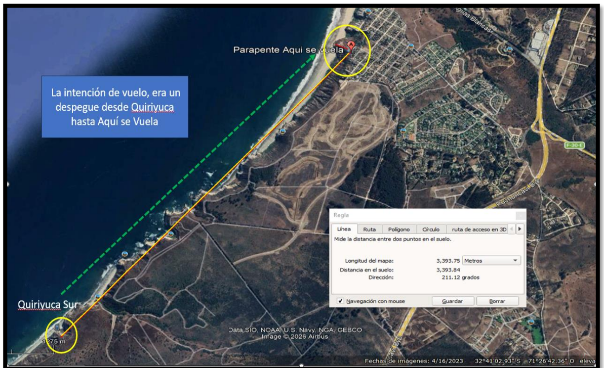
Imagen N°2: Secuencia del suceso.