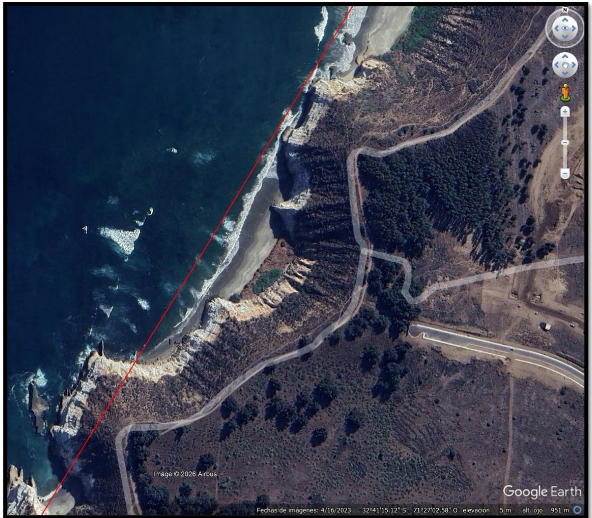
Imagen N° 3

El sitio del suceso corresponde a un sector ubicado en un borde costero de Maitencillo, comuna de Puchuncaví, Reg. Valparaíso. El piloto fallecido fue encontrado en una playa del sector en las coordenadas geográficas: Lat. 32° 41' 16.15" S. y Long. 71° 27' 00" O., conforme a las imágenes N°3 y N°4.