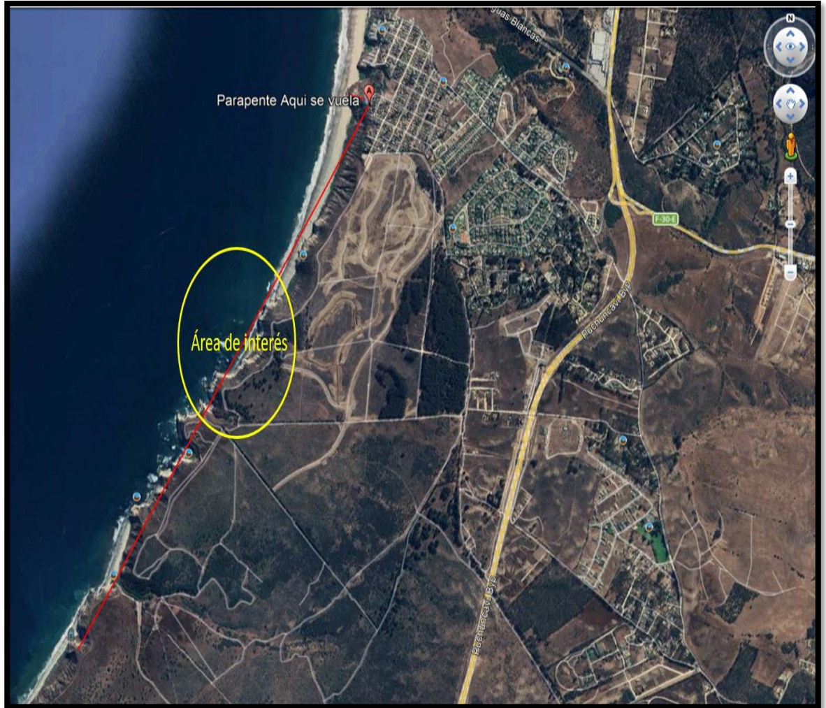
Imagen N° 4