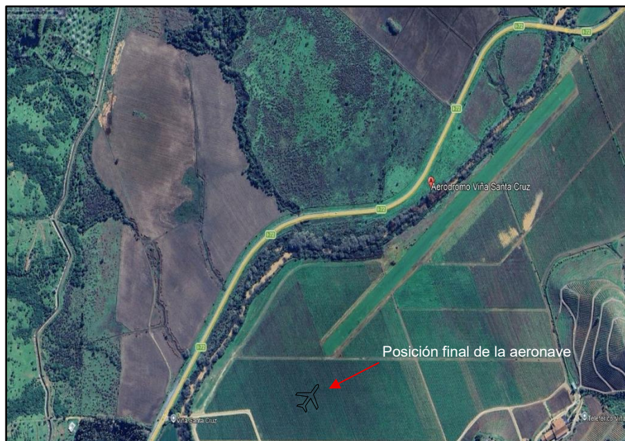
Imagen N° 2: Ubicación sitio del suceso (georreferencia de Google Earth).

El sitio del suceso corresponde al Aeródromo Viña Santa Cruz (SCVZ), comuna de Lolol, Región del Libertador General Bernardo O'Higgins.