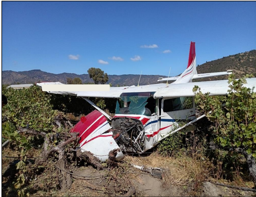
Fotografía N° 5: Daños de la aeronave.