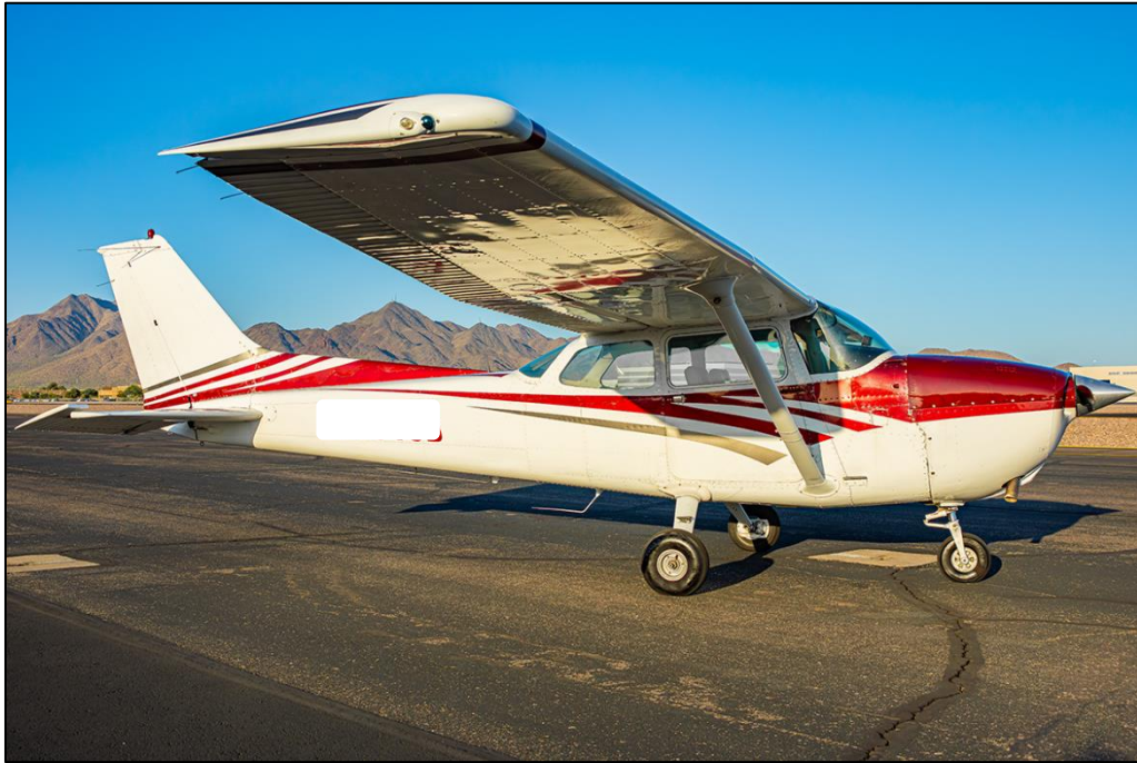
Imagen 1: Avión Cessna 172N (Referencial).