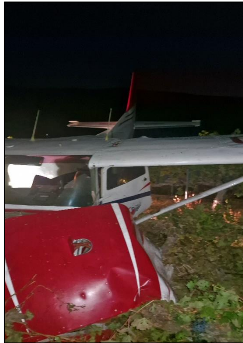
Fotografías N° 3 y 4: Daños de la aeronave.