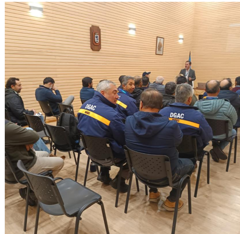
Taller Primeras medidas ante sucesos de aviación 19 de marzo – SCIE