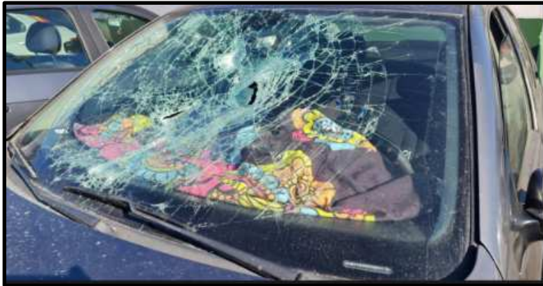
Fotografía N° 1: Vista del daño al parabrisas del automóvil afectado.