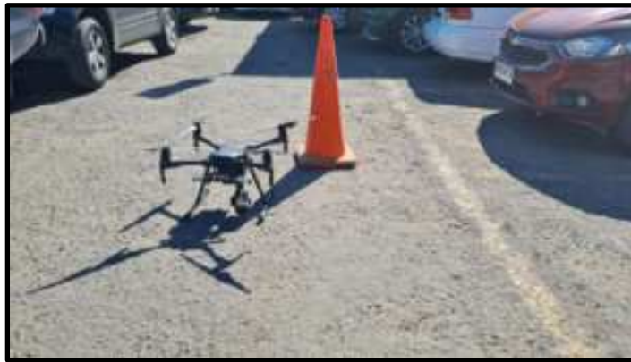
Fotografía N°2: Vista del RPA, previo al inicio de las operaciones.

La fotografía N°2 muestra al RPA involucrado, en el sitio del suceso previo al inicio del vuelo donde se accidentó.