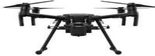
Imagen N° 2: Vista referencial de un RPA DJI Matrice210-V2

Conforme a la imagen (Ver imagen N°2) y a la verificación de los restos del RPA, correspondía a la aeronave DJI, modelo Matrice 210-V2 DJI (cuadrimotor), identificado con el número de serie 17TBHATRO10001.