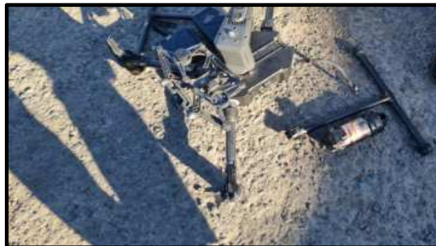
Fotografía N° 3: Vista del RPA accidentado

Posterior a la caída los restos del RPA quedaron en el piso del mencionado estacionamiento (Ver fotografía N°3).