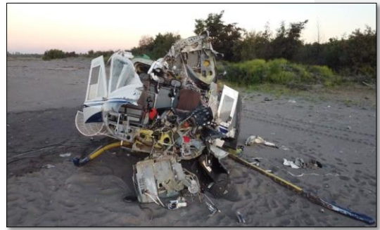
Fotografías N° 1 y 2: Daños del helicóptero