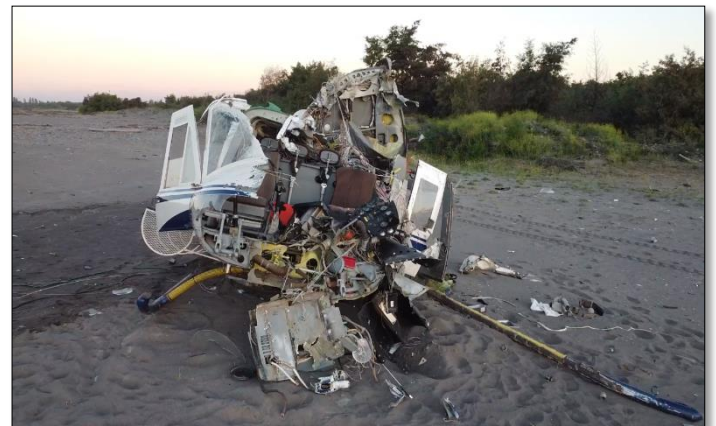
Fotografías N° 1 y 2: Daños del helicóptero